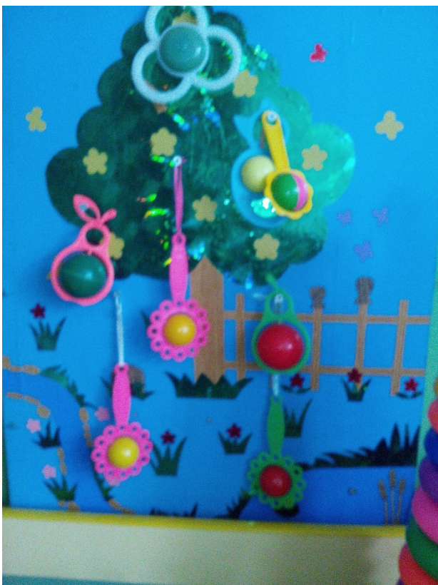
Дидактическое пособие «Погремушки»