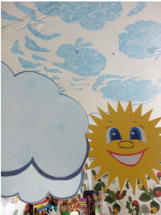
Дидактическое пособие «День-Ночь»