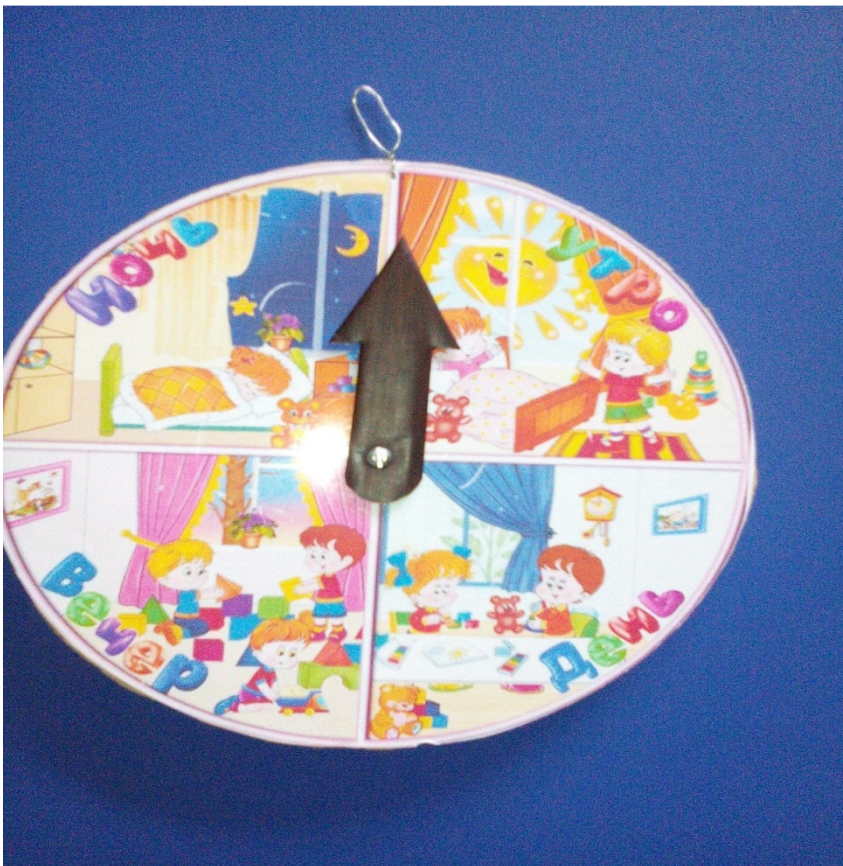
Дидактическое пособие «Части суток»