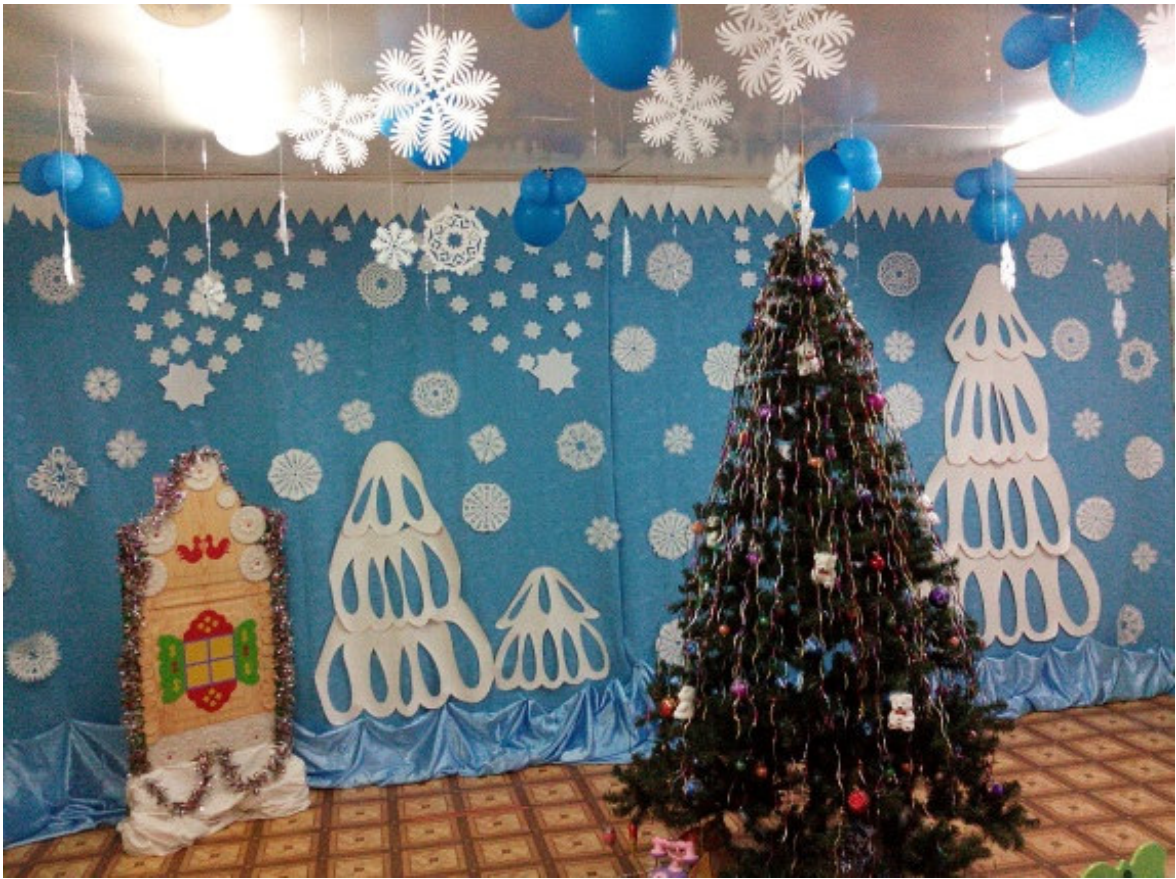
«Оформление зала к Новогоднему празднику»